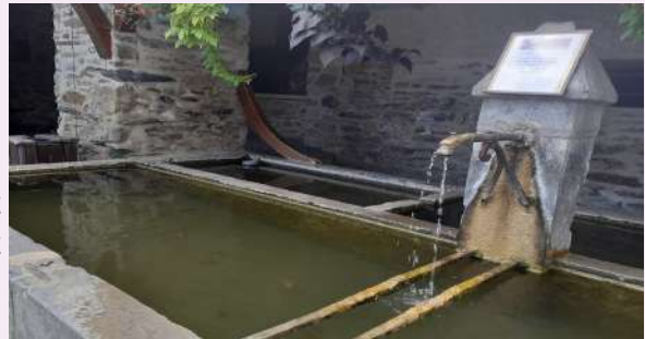
Le mince filet d'eau du bassin du village cet été ..

Je voudrais attirer l'attention de tous, notre planète change, les conditions climatiques se dégradent, nos ressources s'épuisent, et même dans notre havre de paix nous en subissons les conséquences. Nous devons tous en tenir compte et adapter, voire modifier nos comportements. L'eau notamment risque de devenir une denrée plus rare et il est évident qu'il faut l'économiser.