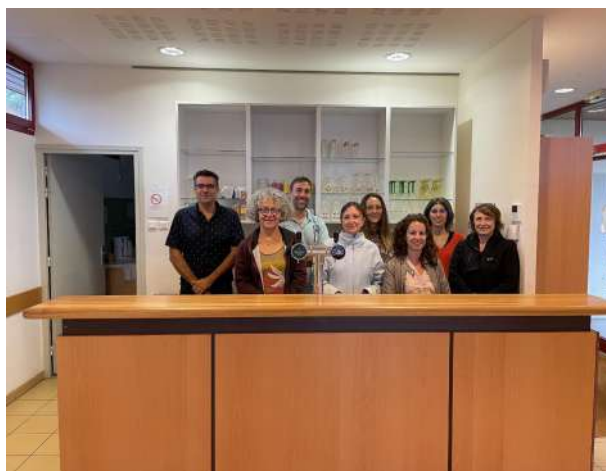
Les membres du bureau du Chab'Kfé

Soif de convivialité et de partage , évidemment... :)