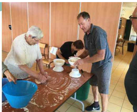
Le savoir faire des anciens à l'honneur !

Samedi, nous avons organisé un concours de pétanque qui avec succès a réuni 25 participants en 8 équipes. Les gagnants ont représenté la parité, avec une équipe composée de 2 femmes et 2 hommes !