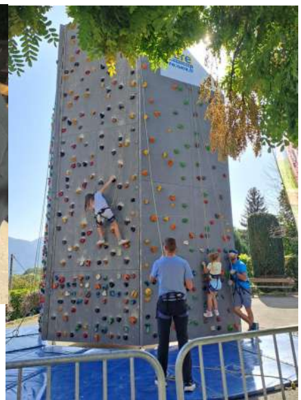
Temps de rencontres intergénérationnelles!